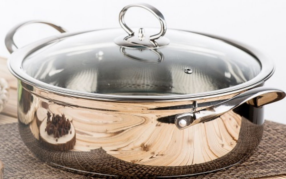
纳福火锅 ( 26-30cm )